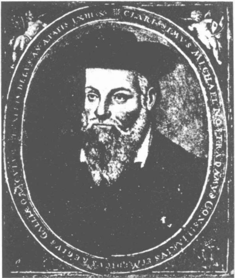
Chân Dung Michael Nostradamus do con ông là Caesar vē.