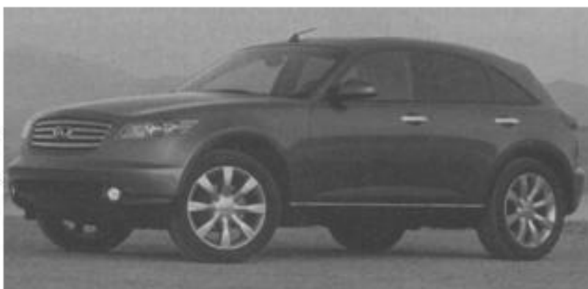
Infiniti Fx45 Photo credit: © Nissan (2003). Infiniti logo are registered trademarks of Nissan North America, Inc.