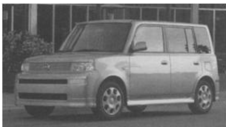
Toyota Scion xB

§ Các cách thiết kế sản phẩm dịch vụ khác nhau. Phụ thuộc vào mô hình quản lý phổ biến, bạn có thể cho rằng chỉ có một cách lý tưởng để tạo ra sản phẩm hay dịch vụ. Điều đó không đúng. Không