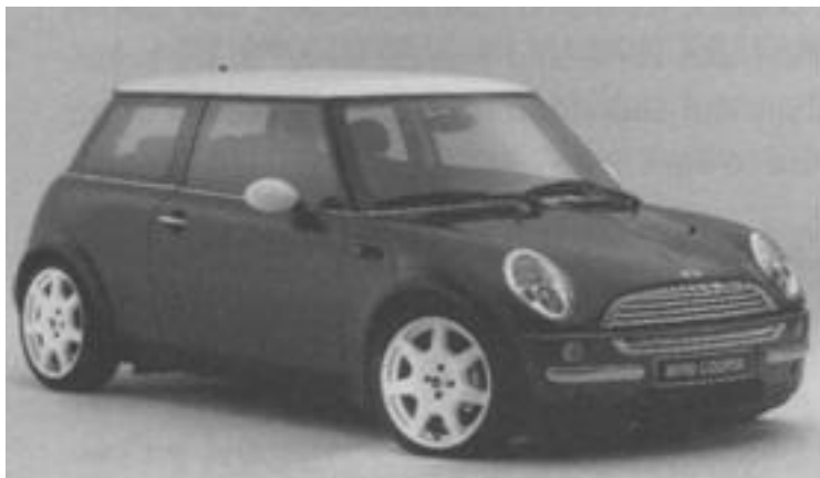
Mini Cooper

Thiết kế xe hơi là một ví dụ điển hình về những phản ứng yêu ghét khác nhau, nhất là khi chúng ta xem xét những phản ứng trái ngược nhau đối với những mẫu xe như Mini Cooper, Infiniti Fx45 và Toyota xB. Người ta hoặc là hết sức ủng hộ hoặc ra sức phản đối, và đó là một tín hiệu đáng mừng.