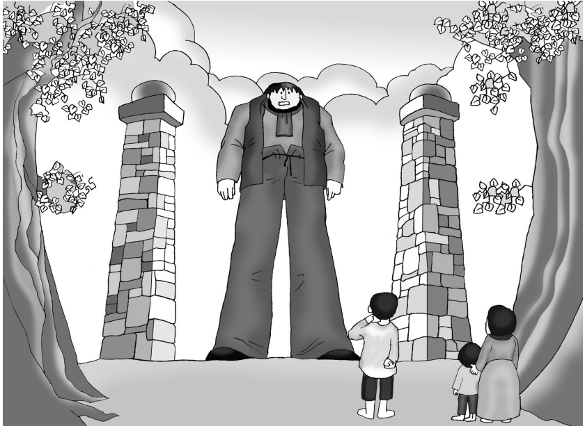
GÃ KHỔNG LỔ GÀO LÊN: “CHŨNG MÀY LÀM GÌ Ở ĐÂY?”

Tan học, các em thường rảo quanh tường rào cao và nói về khu vườn đẹp bên trong. Các em bảo nhau: “Hồi trước ở trong đó bọn mình vui quá!”