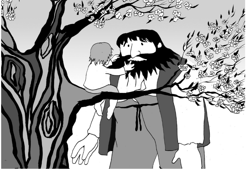
HẮN ĐẶT EM NGÔI TRÊN CÀNH.

Gã khổng lồ nao cả lòng khi nhìn ra vườn. “Giờ thì mình biết vì sao xuân chẳng chịu về đây.”