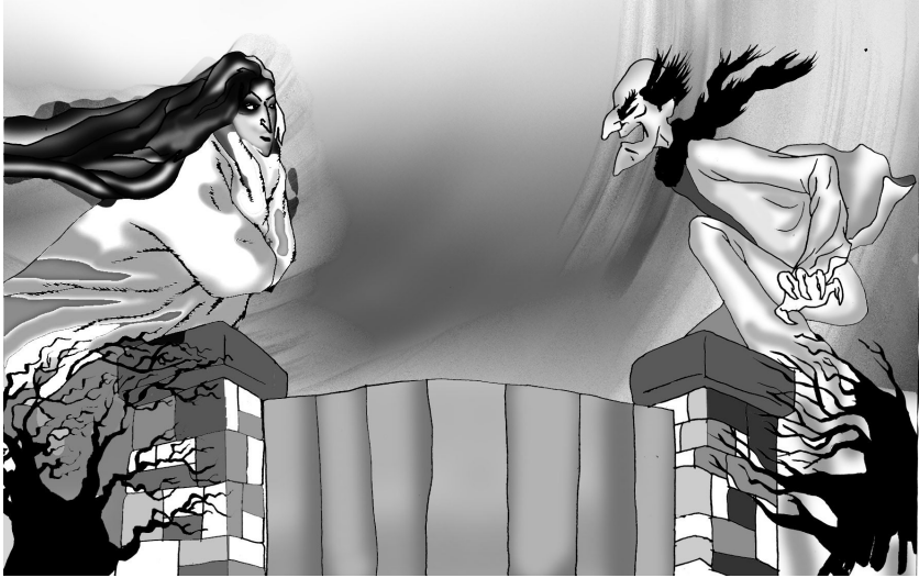
KẸ DUY NHẤT VUI MỪNG LÀ TUYẾT LẠNH VÀ BĂNG GIÁ.

Có lần, một đóa hoa xinh xinh nhô lên khỏi đám cỏ, nhưng nhác thấy cảnh tượng ấy, hoa tội nghiệp cho bọn trẻ đến nỗi thụt trở lại lòng đất và đi ngủ luôn.