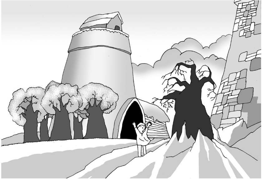
Ở GÓC VƯỜN XA NHẤT VẪN CÒN NGUYÊN MÙA ĐÔNG.

Chim chóc bay quanh và ríu rít reo vui, còn hoa thì ngẩng mặt lên khỏi lớp cỏ xanh và tươi cười.