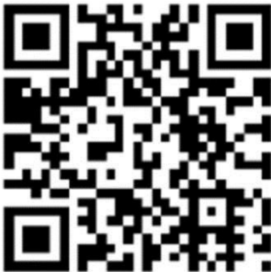
Phim minh họa phương pháp của Google

những kiến thức hữu ích hay những sản phẩm và dịch vụ có giá trị đáng kể. Với nó, khi đại dịch kế tiếp xảy ra, thế giới sẽ có sẵn một công cụ tốt hơn để dự đoán và do đó ngăn chặn sự lây lan.